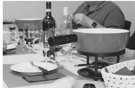
Ob es dann ein wenig «stinkt» oder nicht spielt keine Rolle – man ist ja nicht zu Hause und muss die Lüftung auf Hochtouren laufen lassen.