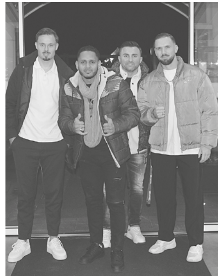
Vorfreude auf einen tollen Abend nach einer guten Vorrunde.