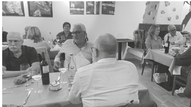
Beste Gesellschaft, feines Essen und dazu ein, zwei Gläschen Wein – man fühlt sich wohl im Club 200.

Es war wie immer ein Abend in äusserst angenehmer und interessanter Gesellschaft. Anregender Austausch von Neuigkeiten, spannende Gespräche und Diskussionen machen die Anlässe des Club 200 so wunderbar interessant. Dazu war für das seelische Wohl bestens gesorgt. Mit gediegenem Apéro wurde man auf das «Herbstmenü» eingestimmt, welches ohne wenn und aber als ausgezeichnet bezeichnet werden kann. Da blieb für das Dessert, hausgemacht durch das Restaurant Bocciacub Grenchen kaum noch Platz. Wie immer, wiederum ein äusserst gelungener Anlass des Club 200.